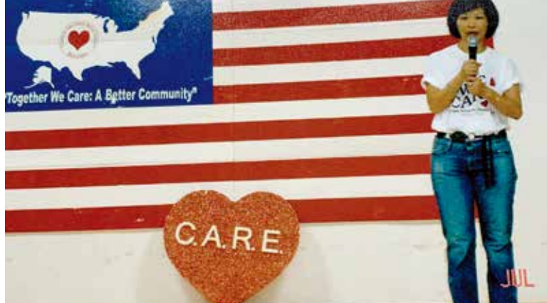
國慶園遊會募款活動主持開幕典禮