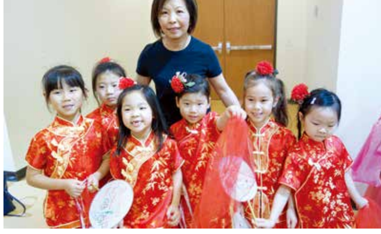
指導中文學校學生民族舞蹈